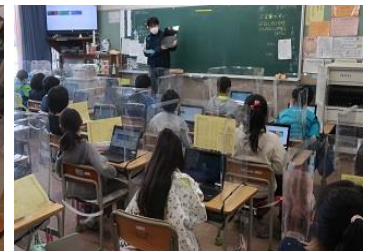
GIGA 開き当日 集中しています

情報モラルとは・・・コンピュータを使って何かをした時に、周りの人たちにどのような影響を与えるか考えることです。ルールを守るだけではなく、友達や周りの方にどういう影響があるのか考えることができる力を身に付けましょう。ふだんの生活でやってはいけないことは、PC を使ってもやってはいけません。